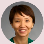
King Chong Chan

Examinatrice-en-chef, Radiologie buccale et maxillo-faciale